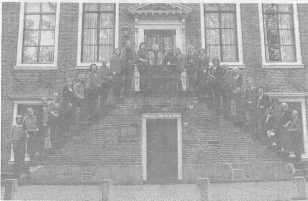
Vrouwenkoor Eigen Wijs viert dit jaar het 12 1/2 jarig jubileum.